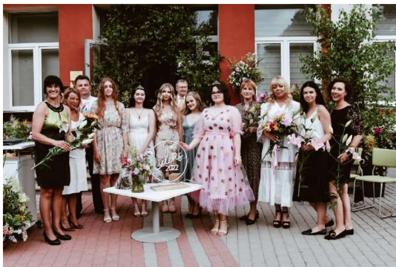
7.attēls. Programmas “Uzņēmējdarbības pamati” Zentas Mauriņas Grobiņas vidusskolas absolventi. Izlaidums 2022.

“LUMA mācību centrs” sadarbojas ar izglītojamā ģimeni: notiek komunikācija par programmas aktivitātēm, vecāki tiek informēti par notikušo – mācību centrs ik mēnesi sūta informatīvo vēstuli- bukletu (skat. 8. pielikumu) par aktualitātēm. Tāpat izglītojamo ģimenes tiek informētas, ja ir izmaiņas programmas norisē, kā arī izglītojamo pārstāvji sazinās ar mācību centru par norisēm, vienmēr var gūt atbalstu par interesējošajiem jautājumiem saistībā ar programmu, mācību norisi, finansiālo mācību procesa daļu. Apzinoties, cik nozīmīga loma izglītojamo atbalstā ir ģimenēm, “LUMA mācību centrs” pievērš īpašu uzmanību komunikācijai ar izglītojamo pārstāvjiem, piemēram, arī izglītojamo izlaidumā ir aicinātas piedalīties viņu ģimenes un tuvinieki, kopā atzīmējot izglītojamo sasniegumus (skat. 7.attēlu).