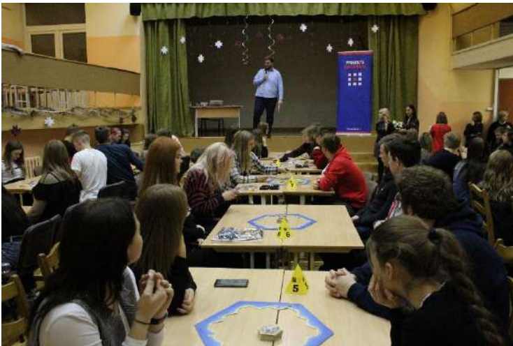
5.attēls. Spēļu nakts 2019

Izglītojamo personības veidošanai, ļaujot viņiem izpaust savus talantus, idejas un radošumu, tiek organizēti gan individuāli izpildāmi, gan grupu darbā veicami projekti, konkursi un spēles, kas attīsta viņu spēju strādāt gan vienatnē, gan komandā. Diemžēl Covid-19 ierobežojumu dēļ, daudzi klātienē pasākumi netika īstenoti vai iespēju robežās tika īstenoti attālināti.