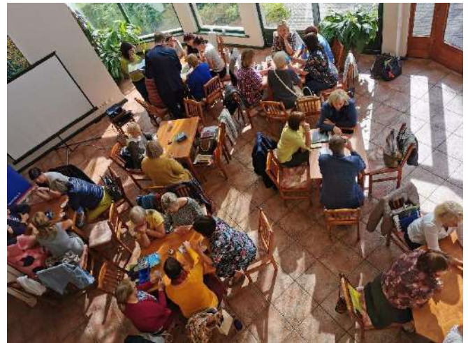
6.attēls. Biznesa spēles 2019