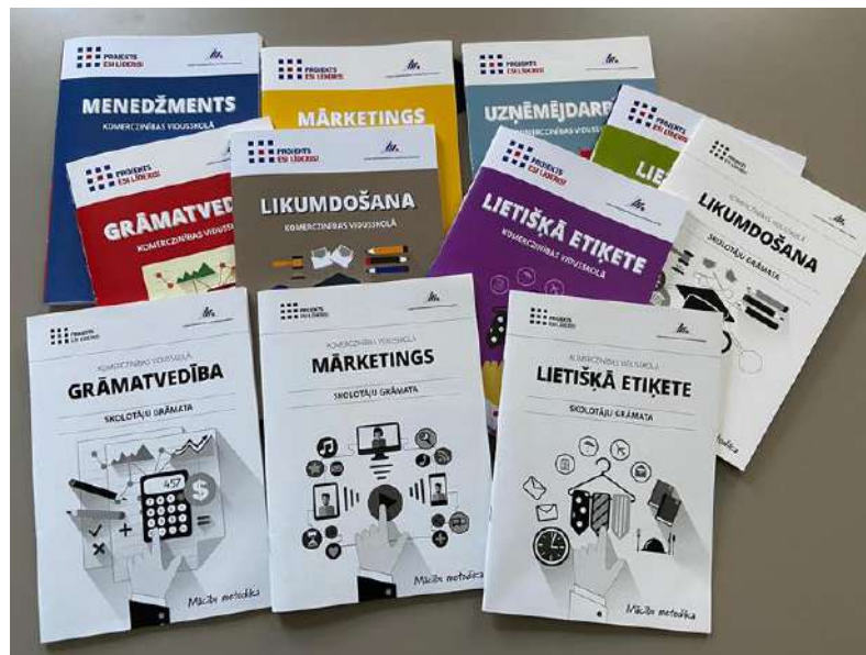
4.attēls. “LUMA mācību centra” izdotie metodiskie materiāli izglītojamiem un pedagogiem.

“LUMA mācību centrā” izmantotie metodiskie materiāli nav adaptēti citu programmu mācību kursi, vai tulkoti pedagoģiskie materiāli, bet sagatavoti un pašu izdoti metodiskie mācību materiāli (skatīt 4.attēlu). Tie ir autentiski un unikāli Latvijas mācībspēku izstrādāti mācību materiāli speciāli paredzēti “LUMA mācību centra” izglītības programmu nodrošināšanai un paredzēto mērķu sasniegšanai.